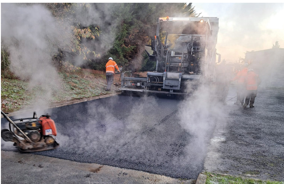
Le parking de la salle polyvalente, très fréquenté, a été remis en état complètement.

Par ailleurs, des travaux de réfection de la chaussée ont été menés rue Alphonse-Allain (à dr. ci-dessous) ainsi que cours Louison-Bobet (à g. ci-dessous), afin de renforcer la qualité et la durabilité des voiries communales.